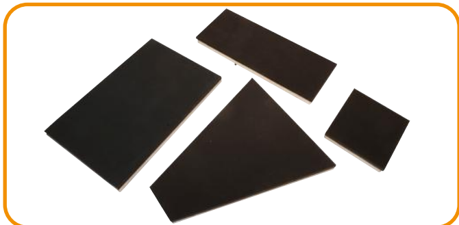
Fig. 8 - Pratos para t-shirt de mulher, oblongo, guarda-chuvas e quadrangular