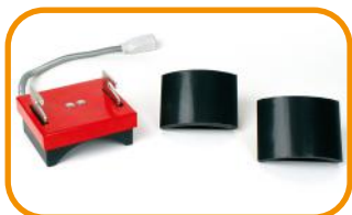
Fig. 6 - Conjunto para bonés