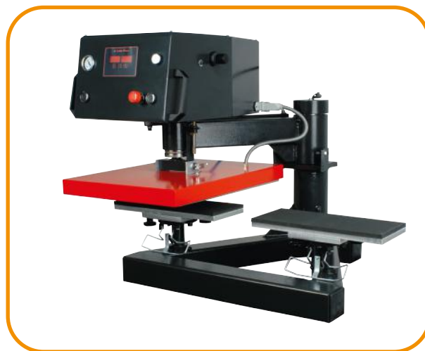
Fig. 3 - Pratos de suporte transversais para mangas e calças