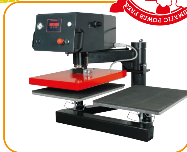
Fig. 1 - Pratos de suporte standard