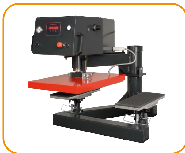
Fig. 4 - Pratos de suporte longitudinais para mangas e calças