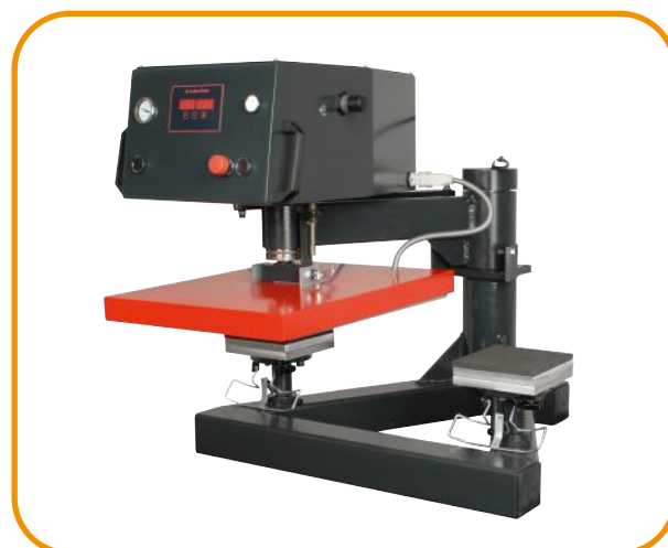
Fig. 2 - Pratos de suporte para bolsos de peito