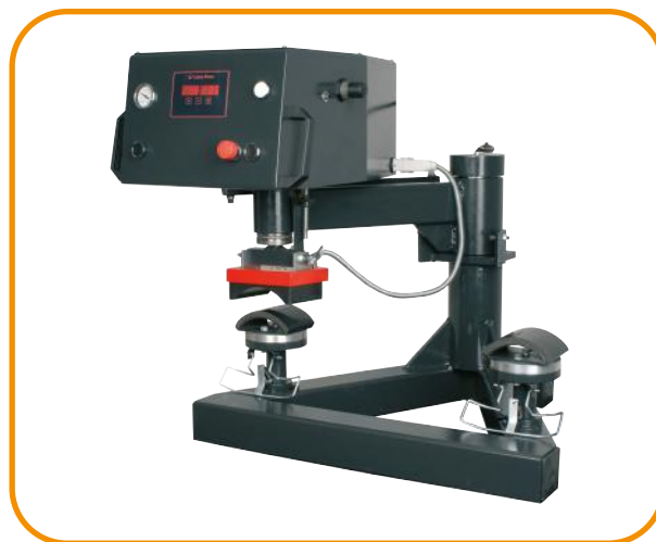
Fig. 5 - Conjunto para bonés